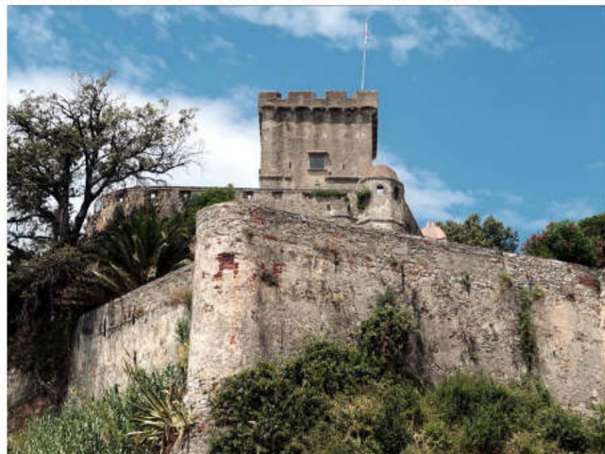
Castello di San Terenzo, Lerici (La Spezia)